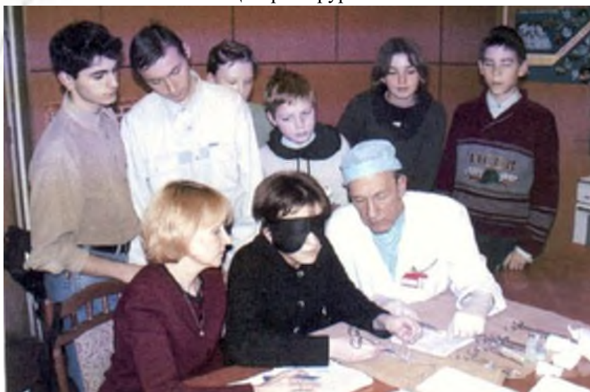
Занятия в реабилитационном центре слепые учатся видеть мозгом